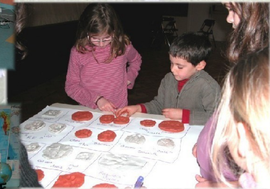
Création d'un moulage d'empreinte