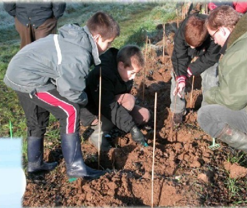
Plantation de haie