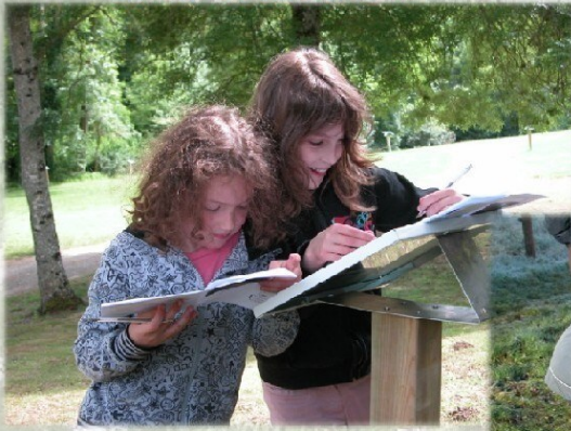
Sentier de découverte