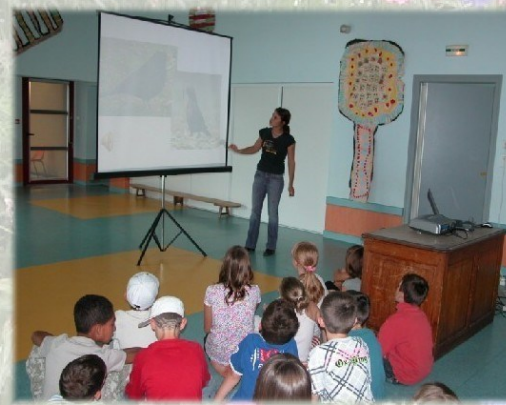
Les oiseaux de nos campagnes