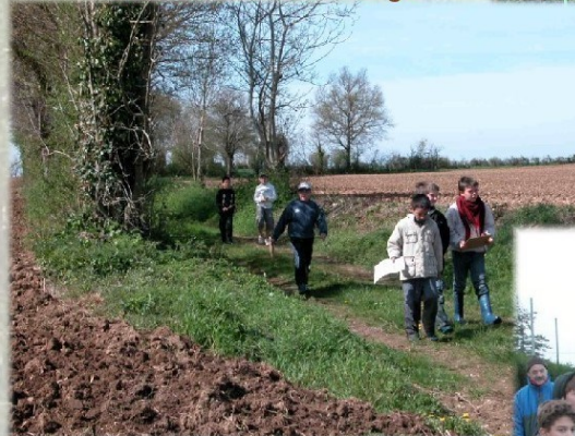
Découverte du bocage