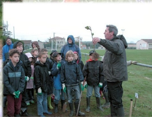
La haie et les arbres